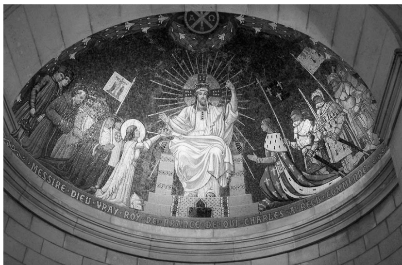
Mosaïque du Christ Roi de France du transept de la Basilique nationale Sainte Jeanne d'Arc du Bois- Chenu à Domrémy